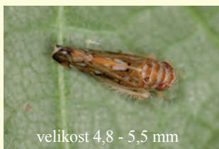
velikost 4,8 - 5,5 mm

Zlato trsno rumenico prenaša žuželka ameriški škržatek, ki je v Sloveniji navzoč povsod, kjer so vinogradi. Za preprečevanje širjenja te nevarne karantenske bolezni je poleg odstranjevanja okuženih trt nujno redno zatiranje ameriškega škržatka v skladu z napovedjo javne službe za varstvo rastlin in je obvezno v vinogradih za pridelavo grozdja na razmejenih območjih zlate trsne rumenice ter v matičnih vinogradih, matičnjakih in trsnicah na celotnem območju Slovenije.