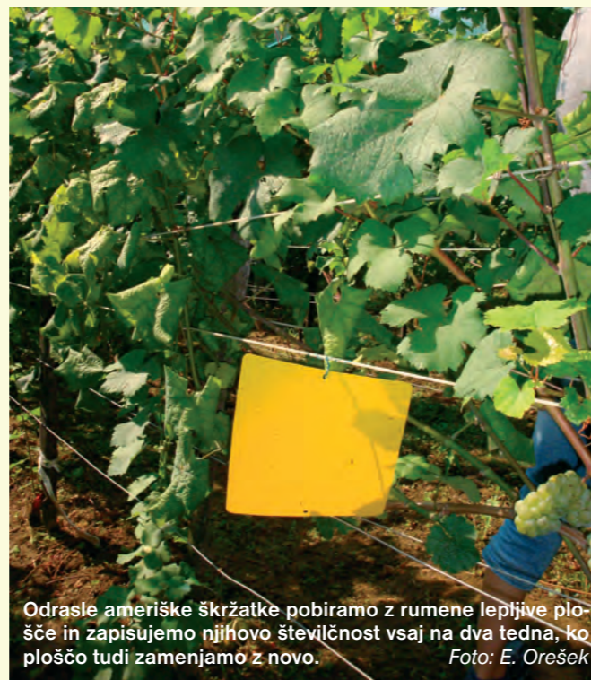
Odrasle ameriške škržatke pobiramo z rumene lepljive plošče in zapisujemo njihovo številčnost vsaj na dva tedna, ko ploščo tudi zamenjamo z novo.

Konec junija, ko se pričenejo izlegati odrasli škržatki, v vinograde nastavimo rumene lepljive plošče. V uporabi so standardne rumene plošče (Unichem, Biotech, Rebel ali Terminator).