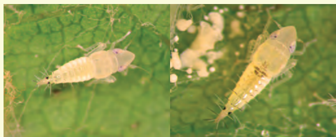
Ameriški škržatek v najprimernejši fazi razvoja za zatiranje: kot ličinka (slika levo - L 2 ) in nimfa (slika desno - L 3 )

Ameriški škržatek ( Scaphoideus titanus Ball) je v naravi glavni žuželčni prenašalec karantenske bolezni trte - zlate trsne rumenice, ki jo povzroča fitoplazma Grapevine flavescence dorée (FD) s sistemsko okužbo trte ( Vitis L.). Fitoplazmo FD prenaša na perzistenten način (kužen ostane celo življenjsko dobo) s trte na trto. Zlata trsna rumenica povzroča veliko gospodarsko škodo zlasti pri pridelavi grozdja. Ameriški škržatek živi predvsem na trti, hrani se z rastlinskim sokom in razvije en rod na leto. Meri od 4.8 do 5.5 mm.