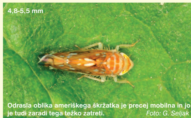
Odrasla oblika ameriškega škržatka je precej mobilna in jo je tudi zaradi tega težko zatreti.

OU Maribor: 02 238 00 00, OU Murska Sobota: 02 521 43 40, OU Ptuj: 02 798 03 60, OU Celje: 03 425 27 70, OU Postojna: 05 721 15 50.